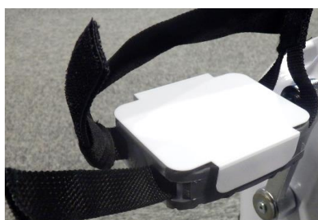
ペダルカバー取付状態