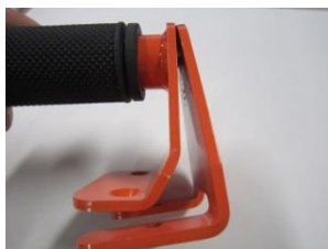
ボルトを緩めた状態